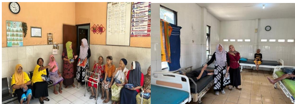
Gambar 1. Dokumentasi pelaksanaan edukasi dan pelatihan pada lanjut usia